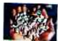
La Côte d'Ivoire est un pays démocratique.