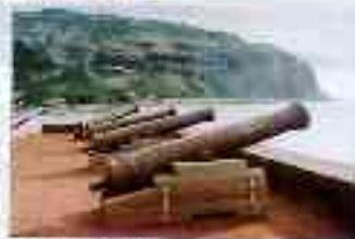
Barachois les canons sur les murs