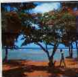
La plage et la côte de l'ouest