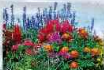
Les fleurs de toutes couleurs