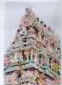
Le Temple St. André