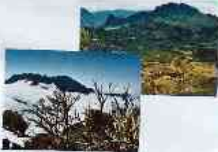
Piton des Neiges