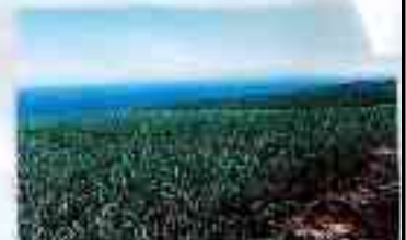
La culture du sucre