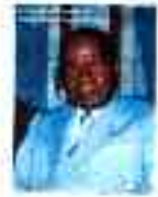
Le président de Côte d'Ivoire